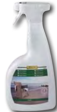
Multi Cleaner Gebinde: 750 ml

Für einen wasserabweisenden Schutz werden die gereinigten Flächen mit WOCA Multi Protector nachbehandelt.