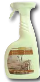
Naturseife Spray 750 ml

Die Pflege mit Naturseife entfernt den Schmutz und gibt gleichzeitig dem Holz eine schützende Schicht. Deshalb ist die Holzbodenseife sowohl reinigend als auch pflegend.