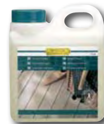
Intensivreiniger 1 l und 2,5 l