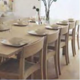
◀ Naturholzmöbel, Tische & Arbeitsplatten