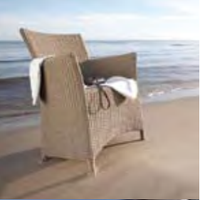
◀ Gartenmöbel aus Polyrattan, Holz, Stahl, PVC