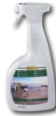
Multi Protector Gebinde: 750 ml

WOCA Multi Protector ist ein umweltfreundliches Produkt, welches ein hohes Maß an Wetterschutz bietet und wasserabweisend ist. Es verleiht einen hervorragenden Schutz gegen Schmutz und Fett. WOCA Multi Protector ist direkt aus einer Sprühflasche und daher sehr leicht anzuwenden.