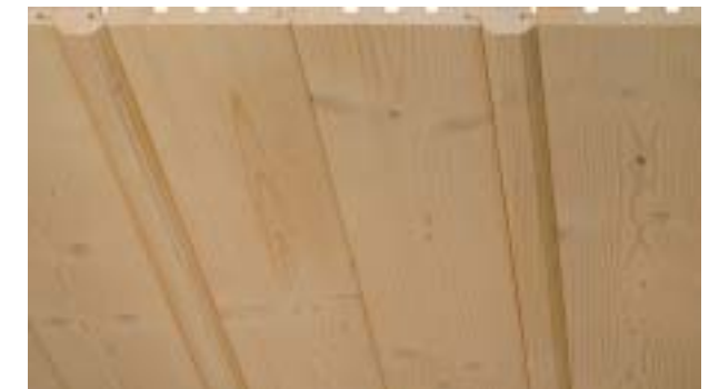
Rundfasebrett, jedes zweite Brett ein Profilstab 23x52