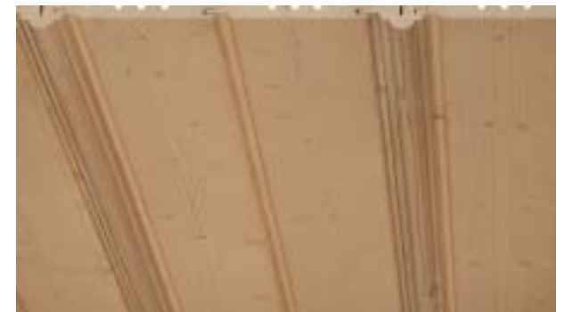
Rundprofil, jedes zweite Brett ein Profilstab 25x60