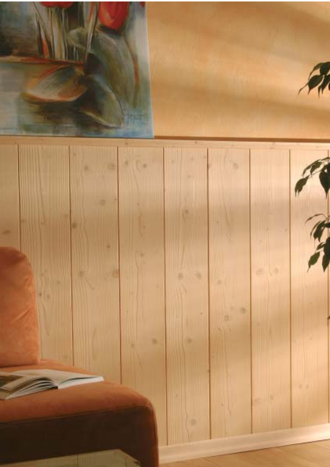
Bergholzprofil & Variationen