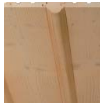
Bergholzprofil mit Stab 34x60