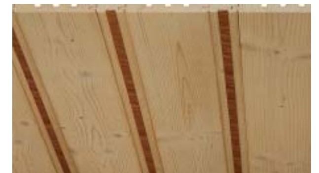
Rundfasebrett mit Exklusivstab