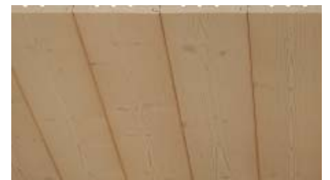
Fasebrett mit Exklusivstab