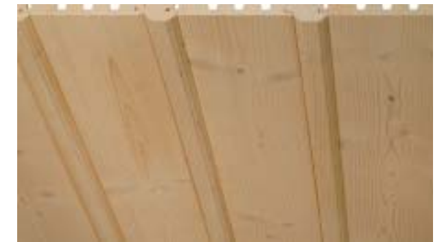
Rundfasebrett mit Profilstab 23x52