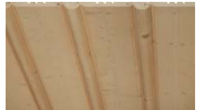
Rundprofil mit Profilstab 23x56