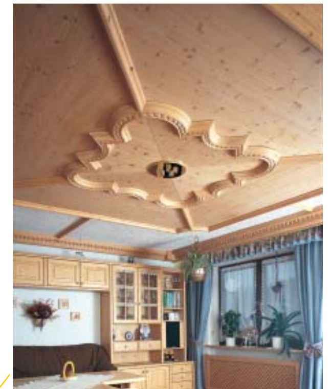
Ornament groß mit Seilschlag