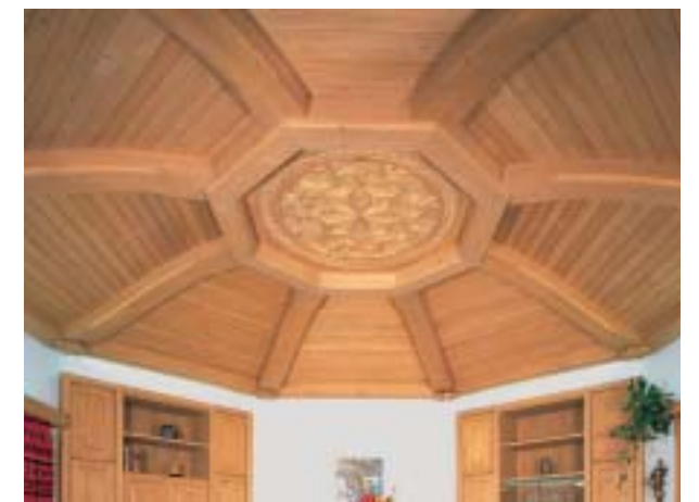
Kuppeldecke mit gotischer Rosette

Gäste betreten zum ersten Mal den Raum und staunen ungläubig: So etwas haben Sie noch nie gesehen. Der Hausherr lächelt nur verschmitzt; er kennt die Reaktion, die diese Deckencreation immer wieder hervorruft.